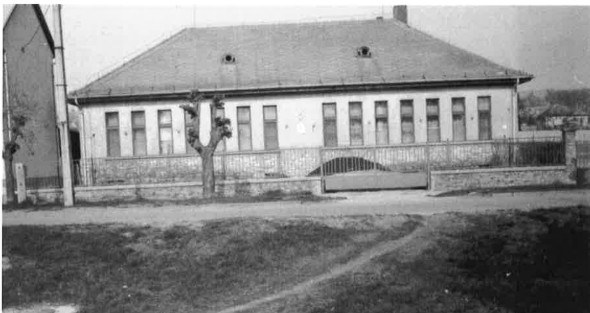
Iskolánk első épülete

Fejér megyében – Székesfehérvár után – másodikként Móraon 1885-ben kezdte meg működését az inasiskola.